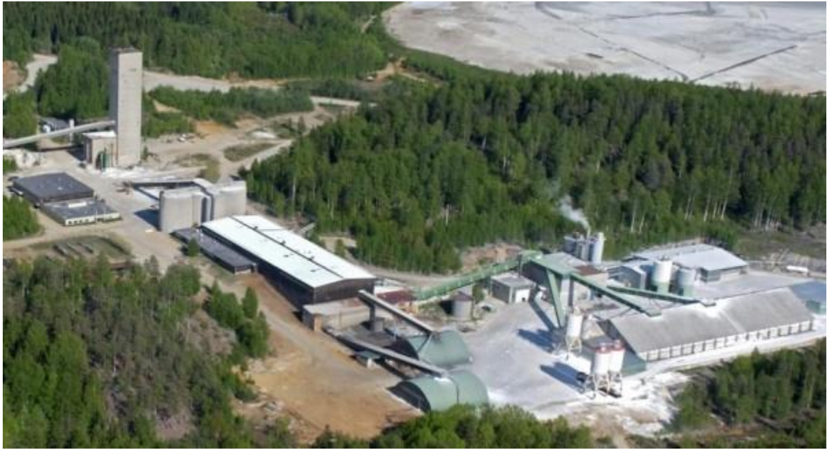
100% owned Luikonlahti plant, 42km from Kylylahti mine